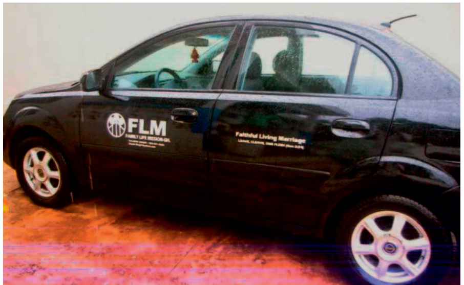
Das Auto von FLM-Ghana

FLM-Liberia möchte immer mehr finanziell unabhängig werden. Dazu haben wir uns ein landwirtschaftliches Projekt ausgedacht, das uns dabei helfen sollte. Wir werden Felder bebauen und die Erträge verkaufen. FLM-International half uns, Material und Saatgut zu kaufen.