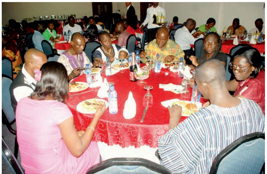
Am Valentinstag (Ghana)